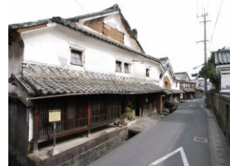
肥前浜宿酒蔵通り