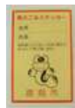
指定ごみ袋・ステッカー