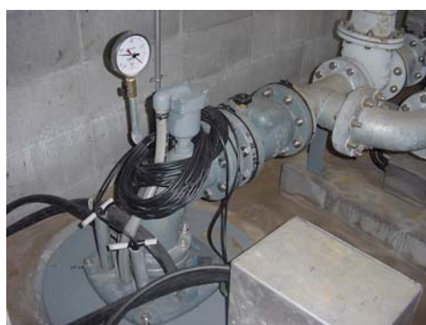
○大村方第1水源地取水ポンプ(H21年度更新)