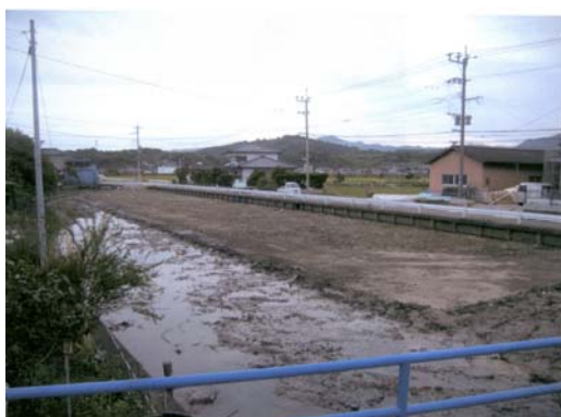
南舟津雨水ポンプ場沈砂池除草業務