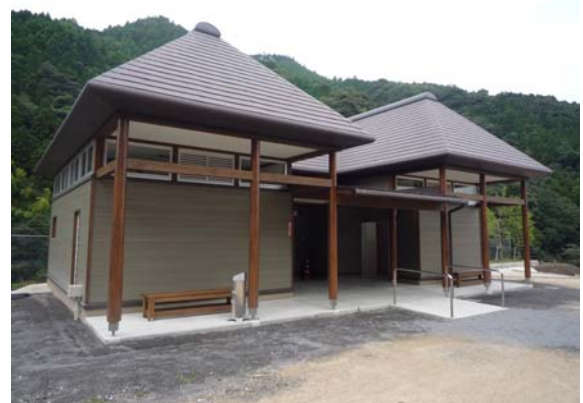
(やまびこ広場トイレ)